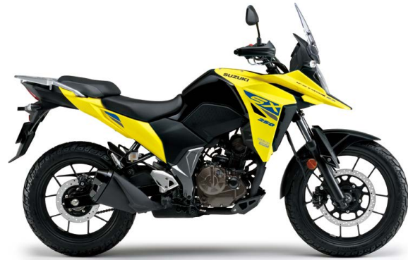
チャンピオンイエロー-No.2 (YU1)