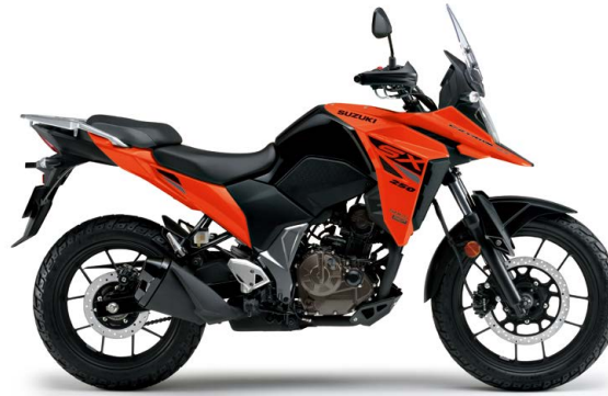
パールプレイズオレンジ (QVN)