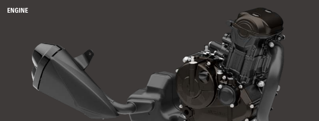
SUZUKI OIL COOLING SYSTEM (SOCS)