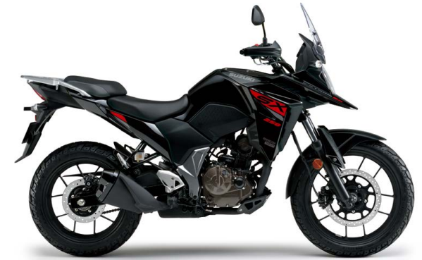
ガラススパークルブラック (YVB)

V-STROM250SX メーカー希望小売価格(消費税10%込み) ¥569,800 (消費税抜き¥518,000)