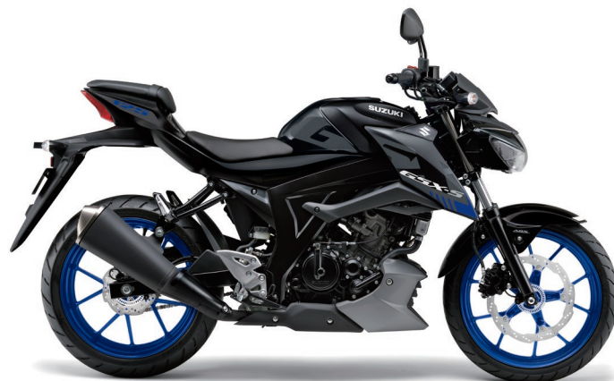
タイタンブラック (YVU)

GSX-S125 ABS メーカー希望小売価格 (消費税10%込み) ¥420,200 (消費税抜き¥382,000)