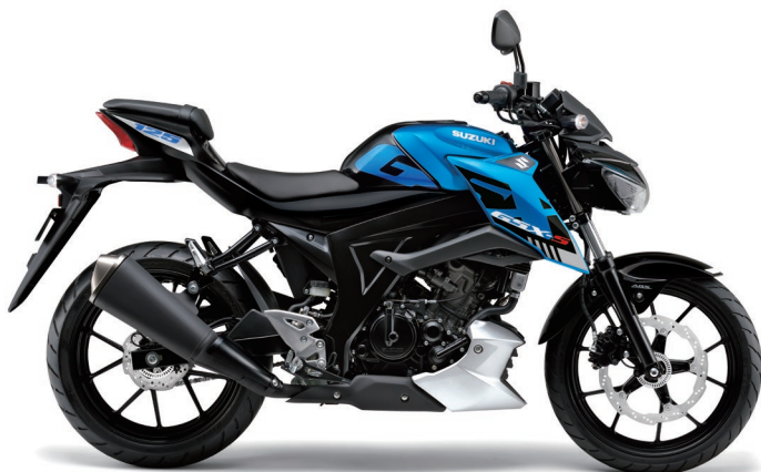
トリトンブルーメタリック/タイタンブラック (BGY)