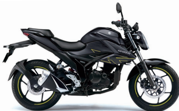
グラススパークルブラック (YVB)