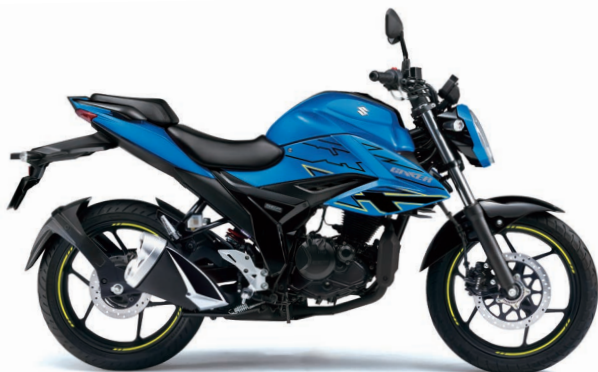
トリトンブルーメタリック (YSF)