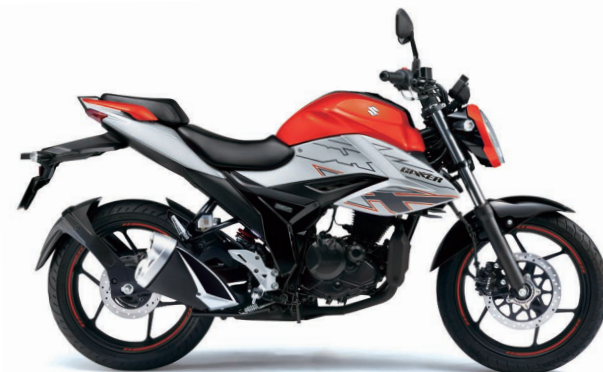
ソニックシルバーメタリック/パープルブレイズオレンジ (CJ9)

ジクサー メーカー希望小売価格(消費税10%込み) ¥385,000 (消費税抜き¥350,000)