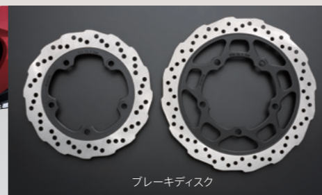
ブレーキディスク