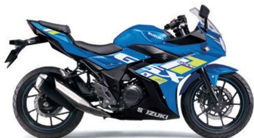
トリトンブルーメタリックNo.2 (CXX)