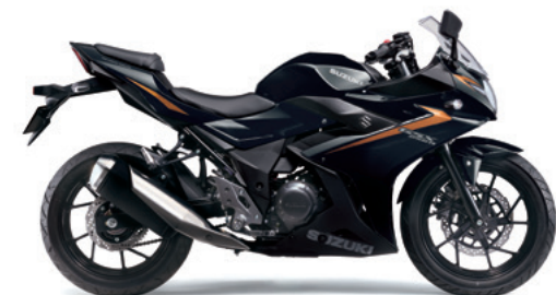
パールネブラーブラック (4CX)