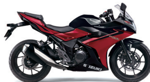
ダイヤモンドレッドメタリック/パールネブラーブラック (BKJ)