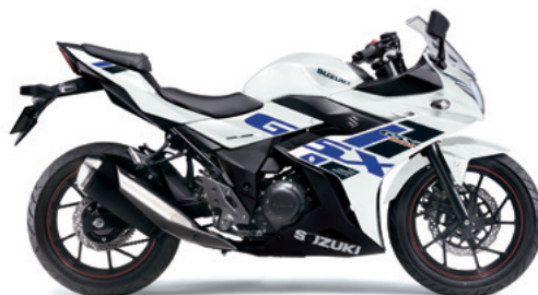
パールグレッシャーホワイトNo.2 (CYX)