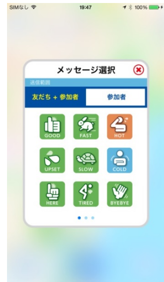
「つぶやき」送信画面イメージ