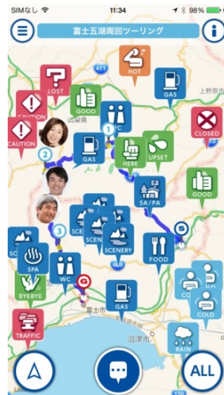
「足あと」の共有イメージ