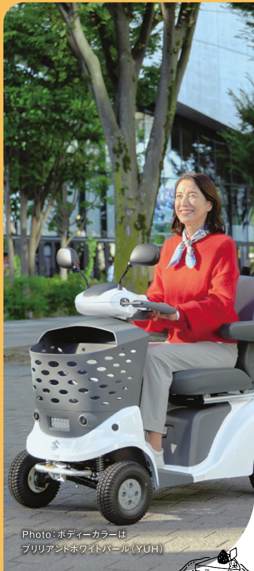
ボディーカラーは ブリリアントホワイトパール (YUH)