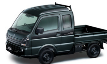
ブルーイッシュブラックパール3(ZJ3)