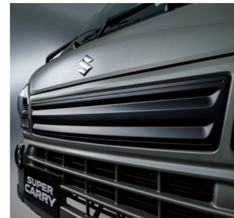
専用フロントガーニッシュ[ブラック塗装]