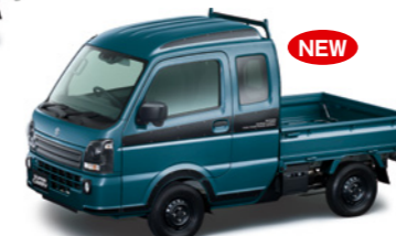
デニムブルーメタリック(WAC)