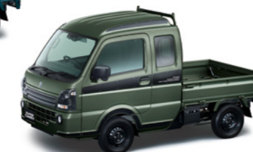
クールカーキーパールメタリック(ZVD)