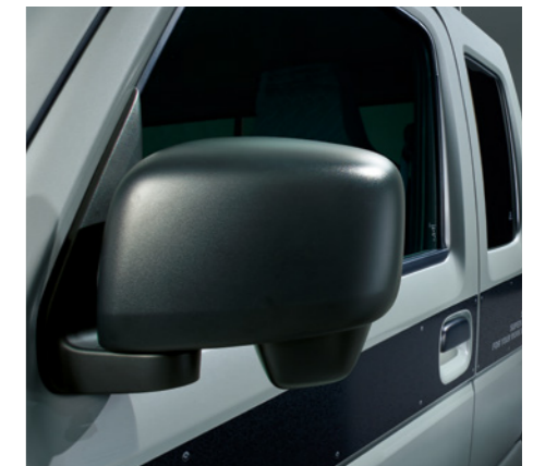
ドアハンドル[ブラック]、ドアミラー[ブラック]