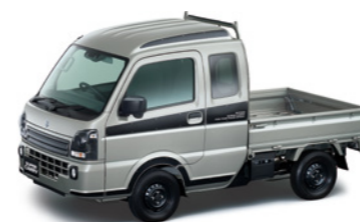
モスグレーメタリック(WBW)

▲ 運転支援を目的としています。■ 検知性能・制御性能には限界があります。これらの機能に頼った運転はせず、常に安全運転を心がけてください。■ 状況によっては正常に作動しない場合があります。■ 対象物、天候状況、道路状況などの条件によっては、衝突を回避または被害を軽減できない場合があります。■ ハンドル操作やアクセル操作による回避行動を行なっているときは、作動しない場合があります。■ ご注意いただきたい項目がありますので、必ず取扱説明書をお読みください。■ 詳しくは販売会社にお問い合わせください。