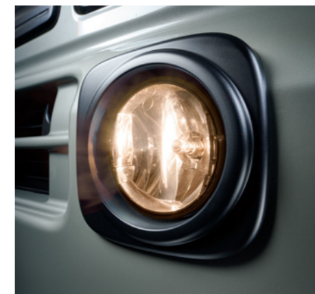
専用フォグランプベゼル[ブラック塗装]