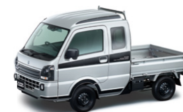
シルキーシルバーマタリック(Z2S)