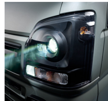
専用LEDヘッドランプ[ブラック塗装]