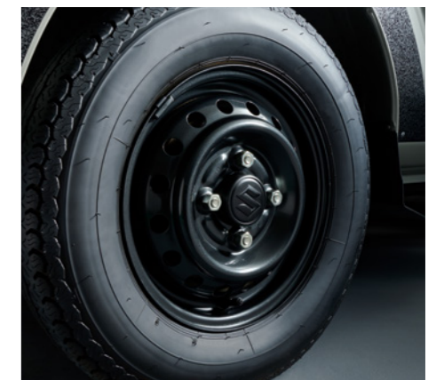
専用スチールホイール[ブラックメタリック塗装]