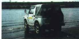
千葉市在住の相葉夫妻のお手紙と写真です。また楽しいお便りくださいネ!!