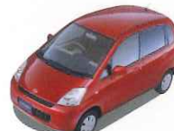
MRワゴンミニカー...10名様