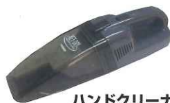
ハンドクリーナー...2名様