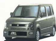
ワゴンミニカー...5名様