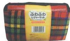
レジャーシート...4名様