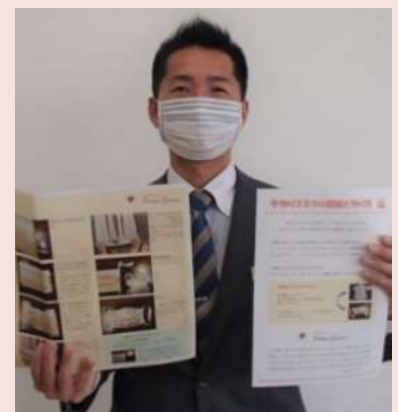
#中学の家庭科以来