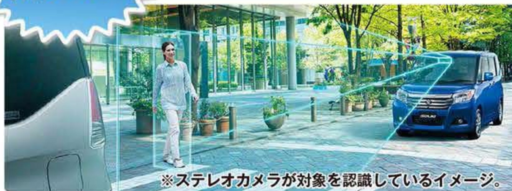
※ステレオカメラが対象を認識しているイメージ。

2つのカメラで人もクルマもキャッチ! また、車線の左右の区画線もキャッチする など、カメラからのさまざまな情報をもとに、 警告や自動ブレーキで衝突回避をサポートします。