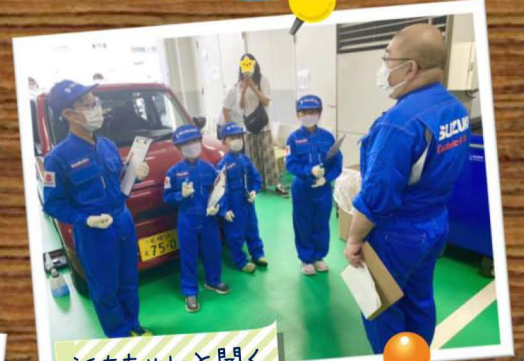
話をちゃんと聞く