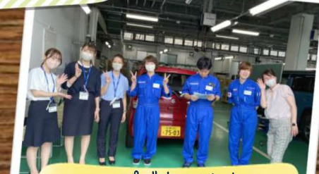
ヘルプで来てくれた サービススタッフ、新入社員