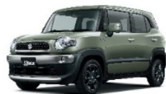
タフカーキ パールメタリック