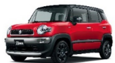
バーニングレッド パールメタリック ブラック2トーンルーフ