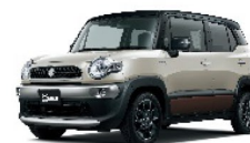
キャラバンアイボリー パールメタリック 3トーンコーディネート