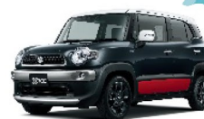
スーパー ブラックパール 3トーンコーディネート (赤)