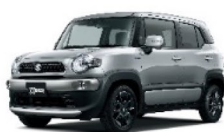
プレミアム シルバーメタリック