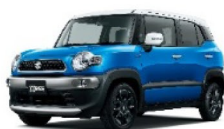
スピーディー ブルーメタリック ホワイト2トーンルーフ