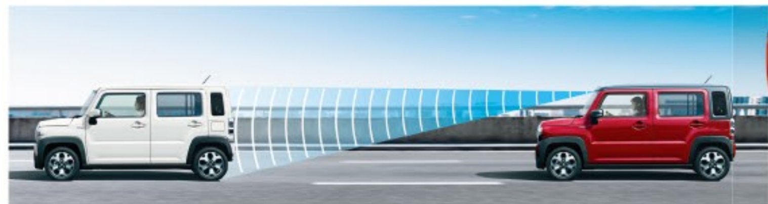
HYBRID G ターボ / HYBRIDX ターボ

ハンドルのスイッチを操作すると先行車との距離を測定し、設定した車間距離を保ちながら加速・減速・停止まで自動追従します! 高速道路での長距離運転などが楽に!