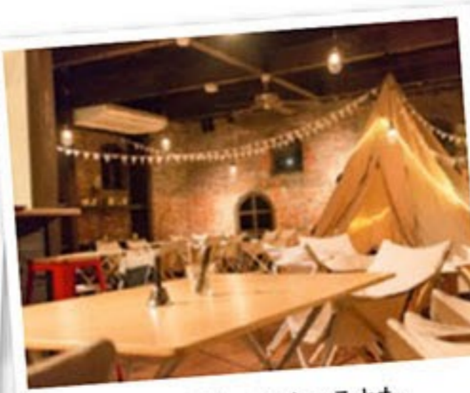
雰囲気がとってもステキなキャンプスペース。1度は利用してみたい！

〒955-0062 三条市仲之町2-15 TEL/0256-55-1162 OPEN/CLOSE カフェスペース 11:00～23:00 キャンプスペース ランチ 11:00～14:00 (LO 13:30) ディナー 18:00～23:00 (LO 22:30) 定休日 毎週月曜日（祝日の場合は営業）