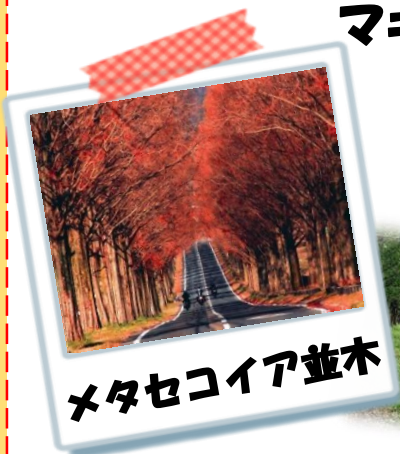
メタセコイア並木

※カーナビゲーションで目的地設定の際「マキノピックランド」0740-27-1811をご登録下さい。