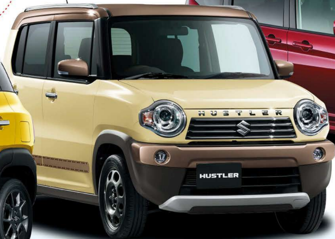
Photo:ハスラーワンダー ボディカラーはシフォンアイボリーメタリック ワッパブラック2トーンルーフ