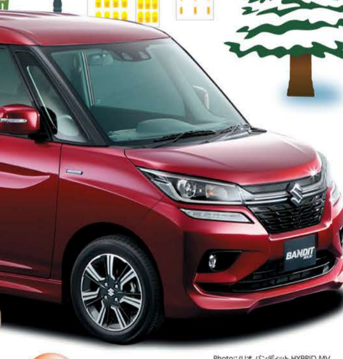
Photo:ソリオ バンディット HYBRID MV ボディカラーはワレットレッドメタリック