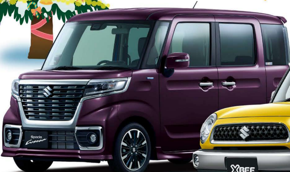
Photo:スぺシアカスタム HYBRID X5ターボ ボディカラーはムーンライトバイオレットパールメタリック

ピュアホワイトパール ブラック2トーンルーフ キャラバンアイボリー パールメタリック ブラック2トーンルーフ