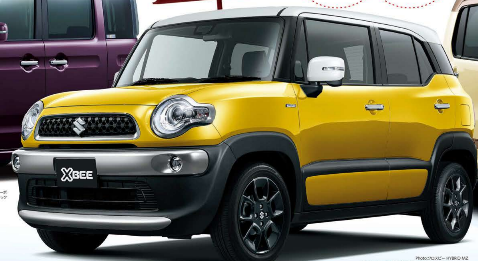
Photo:クロスビー HYBRID MZ ボディカラーはラッシュイエローメタリック ホワイト2トーンルーフ