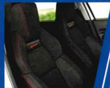
適度な硬さの足回りとホールド感抜群のシートで、機敏かつ快適な乗り心地。