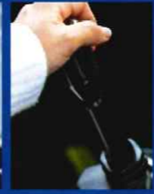
「SUZUKI」エンブレムでレトロな雰囲気に。重いシフトノブでギアの入りも◎