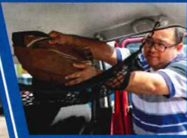
天井には収納ネットをオプション装備し、高いフロアを有効活用している。

人と被らない色の車を探している時に、ピンクのハスラーが登場したのでこの車を選びました。いろんなことが楽しめる「秘密基地」のような車に仕上げたいですね。買った当初から先輩にステッカー貼られたりしてイジられてます(笑)