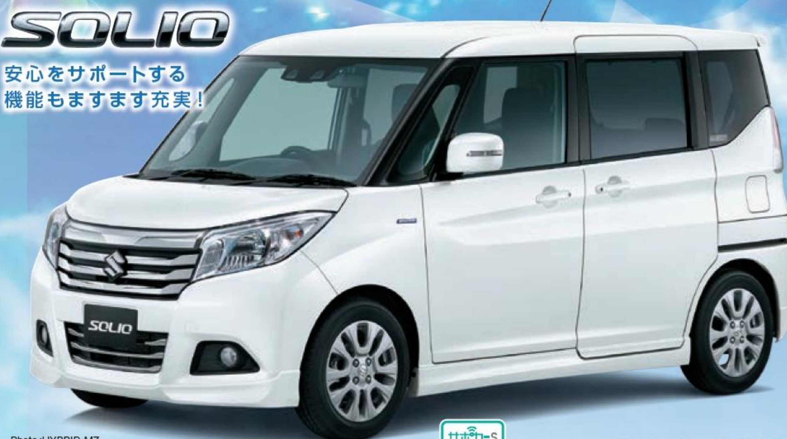
Photo:HYBRID MZ ボディカラーはビュアホワイトパール