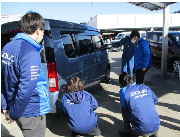
●修理波跡 W を斜めから確認