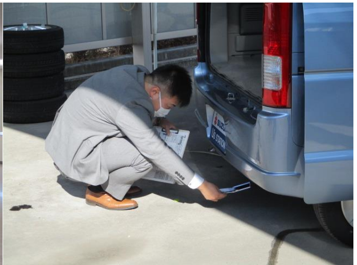
●鏡を使用して車両の下回りを確認