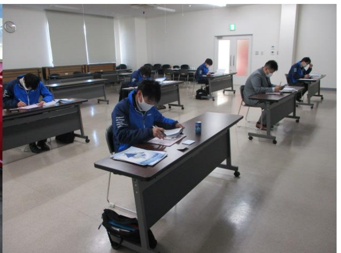
●試験車両のカーチェックシートをまとめる

■スズキ査定向上研修2日目今回は第10回スズキ四輪代理店机上査定試験80点以上獲得した直販担当者6名で実施しました。通常営業日の為、洗車カーポートにて実車査定を実施。担当者は、外板の再塗装や修理跡が発見出来ないと修復歴へとつながる瑕疵を見落とすと解説を受けた後何度も車両を確認し、修理跡が分かるまで見直しておりました。修理箇所はなんとなくわかるが修復歴となるか、ならないかの判断までが現状できていない様子でした。天候は快晴であたたかく無事2日目の研修を修了いたしました。研修後、室内、研修車両の消毒もいたしました。