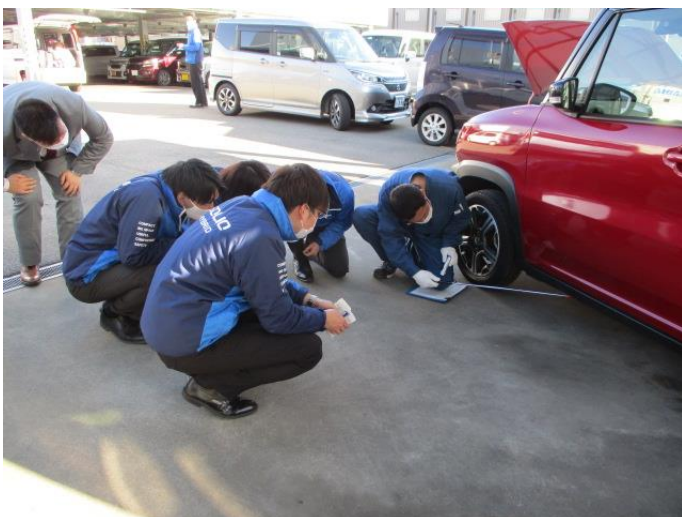
●講師によるクランプ跡の解説