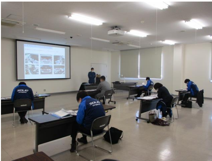
●午前中 座学による査定基準のおさらい