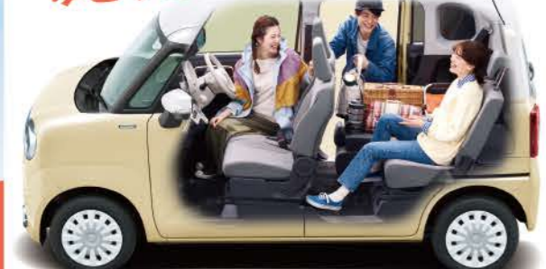
Photo / HYBRID X セーフティプラスパッケージ全方向モニター付メモリーナビゲーション装着車 (シフトレバーにメタリックアーク(シフトアップ専用)) ※写真中のフロアマットは販売会社装着アクセサリー(別売)です。