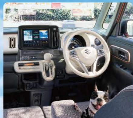
Photo / HYBRID X セーフティプラスパッケージ 全方向モニター付メモリーナビゲーション装着車 (シフトレバーにメタリックアーク(シフトアップ専用)、 リアシートにメタリックウッディグラウンディング、 フロントシートにメタリックウッディグラウンディング) ※写真中のフロアマットは販売会社装着アクセサリー(別売)です。