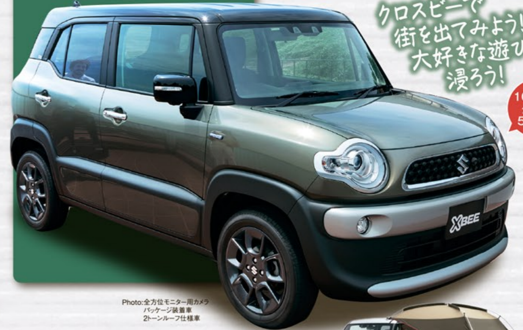
Photo:全方位モニター用カメラ パッケージ装着車 2トーンルーフ仕様車