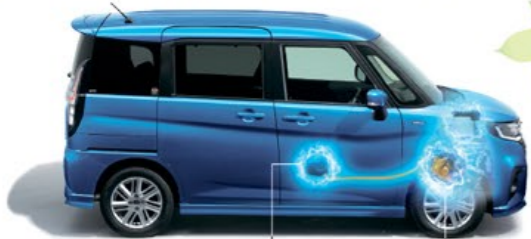
リチウムイオンバッテリー ISG(モーター機能付発電機)

*1 機種・グレードによって異なります。詳しくは販売会社にお問い合わせください。