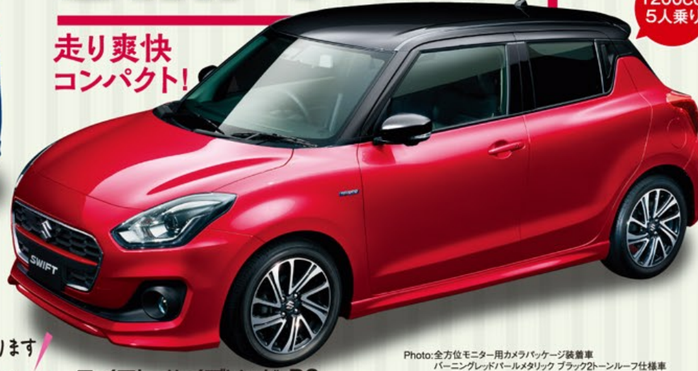
Photo:全方位モニター用カメラパッケージ装着車 パーニングレンドパールメタリック ブラック2トーンルーフ仕様車