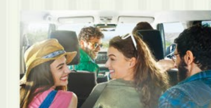
Photo:全方位モニター用カメラ パッケージ装着車 キャラバンアイボリーパールメタリック ホワイト2トーンルーフ仕様車