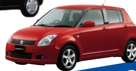
2004年 ＜スイフト＞ 欧州で走りデザインを磨き上げた世界戦略車。スイフトは26の国・地域で122の賞を受賞。