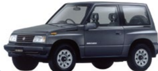
1988年 ＜エスクード＞ オンロード、オフロードを問わない快適性と走破性を両立した都市型小型SUV。