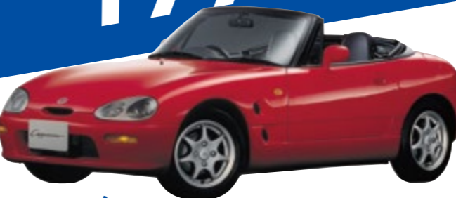
1991年 ＜カブチーノ＞ 思いのままに操縦する楽しさを追求するというコンセプトのもと誕生。キャッチフレーズは「オープンマインド2シーター」。