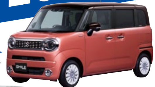
2021年 ＜ワゴンRスマイル＞ 高いデザイン性とスライドドアの使い勝手を融合させた、新しい軽ワゴン。