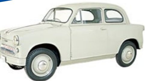
1955年 ＜スズライトSS＞ 日本初の量産軽自動車。名称は「スズ＝スズキの略＋ライト＝軽い・光明」に由来。