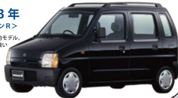
1993年 ＜ワゴンR＞ 今日の軽自動車人気の礎を築いた歴史的モデル。乗る人を最優先した快適で使い勝手の良いパッケージングが高く評価された。