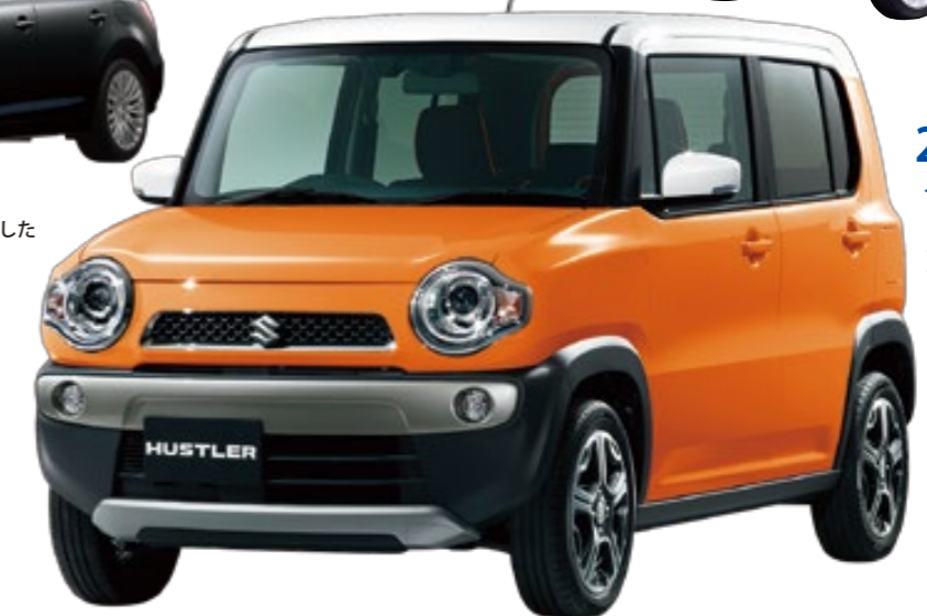
2014年 ＜ハスラー＞ 広い室内とラフロード走破性を備えた軽クロスオーバー。スズキのヒット作の一つとなった。