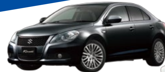
2009年 ＜キザシ＞ 世界レベルの走り快適性を追求した新型セダン。最高出力は138kW。