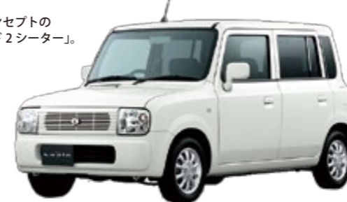
2002年 ＜アルトラバン＞ “身近な雑貨や家具のような愛着の持てる道具”という発想から誕生した。「ラバン」はフランス語で「うさぎ」の意味。