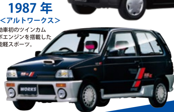
1987年 ＜アルトワークス＞ 軽自動車初のツインカムターボエンジンを搭載した高性能軽スポーツ。