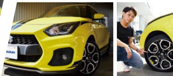
ボディカラーと同じホイールのロゴプレートもスポーツ感をより際立たせている。

デカールも含め、オプションフル装備のコンプリート車。走りはもちろん、中でもお気に入りののが覗んでいるような迫力のあるアイラン。デカールと組み合わせることで、より印象的でスポーティな見た目に仕上がっています。