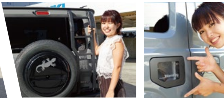
リアラダーを設置。今後、ルーフキャリアを設置する予定。

以前からジムニーが大好きで、実はこれが3台目になり3台とも所有しています。何と言ってもこの角ばったデザインが大好き！それに車は絶対MT車と決めています。所々オプションやアレンジを加えて楽しんでいます。