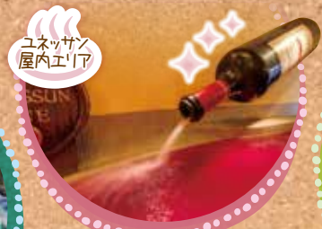
ユネッサン 屋内エリア