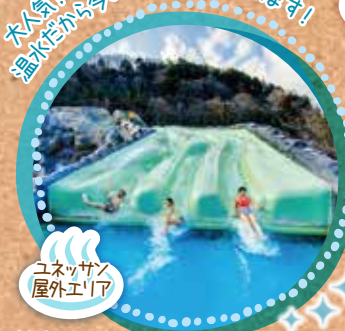
ユネッサン 屋外エリア