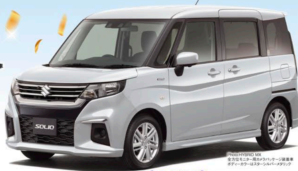
Photo:HYBRID MX 全方位モニター用カメラパッケージ装着車 ボディカラーはスターシルバーメタリック

2WD CVT (FBXB-JM) 車両本体価格 ..... 1,905,200円(税込) 特別装備品合計 ..... 301,422円(税込) ●8インチナビセット149,105円 ●ナビ電源ハーネス4,400円 ●ドライブレコーダー(前後方録画用)71,720円 ●カメラコントロールキット27,115円 ●ETC車載器21,120円 ●ETCセットアップ2,750円 ●TVコントロール25,080円 ●スピードナット132円 合計 ..... 2,206,622円(税込)のところ