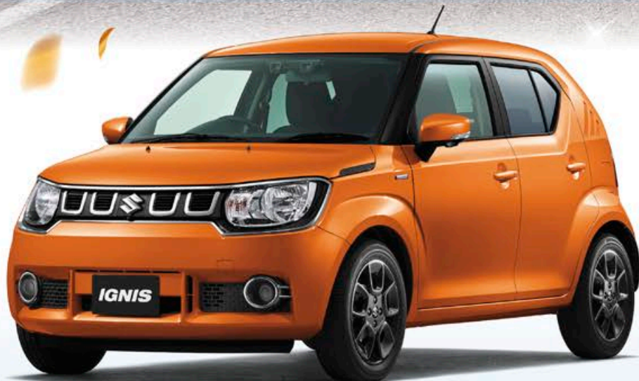
Photo:HYBRID MX 全方位モニター用カメラパッケージ装着車 ボディカラーはプレミアムオレンジパールメタリック