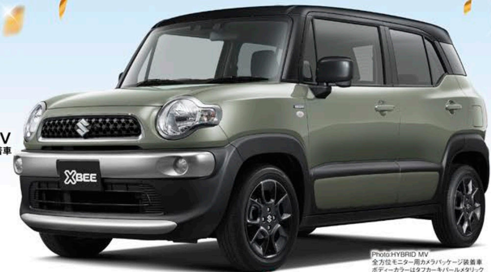
Photo:HYBRID MV 全方位モニター用カメラパッケージ装着車 ボディカラーはタフカーキパールメタリック ブラック2トーンルーフ

2WD 6AT (CBVK-JM2) 車両本体価格 ..... 2,047,100円(税込) 特別装備品合計 ..... 267,795円(税込) ●8インチナビセット149,105円 ●ドライブレコーダー(前後方録画用)71,720円 ●ETC車載器21,120円 ●ETCセットアップ2,750円 ●TVコントロール18,700円 ●ガーニッシュ4,400円 合計 ..... 2,314,895円(税込)のところ