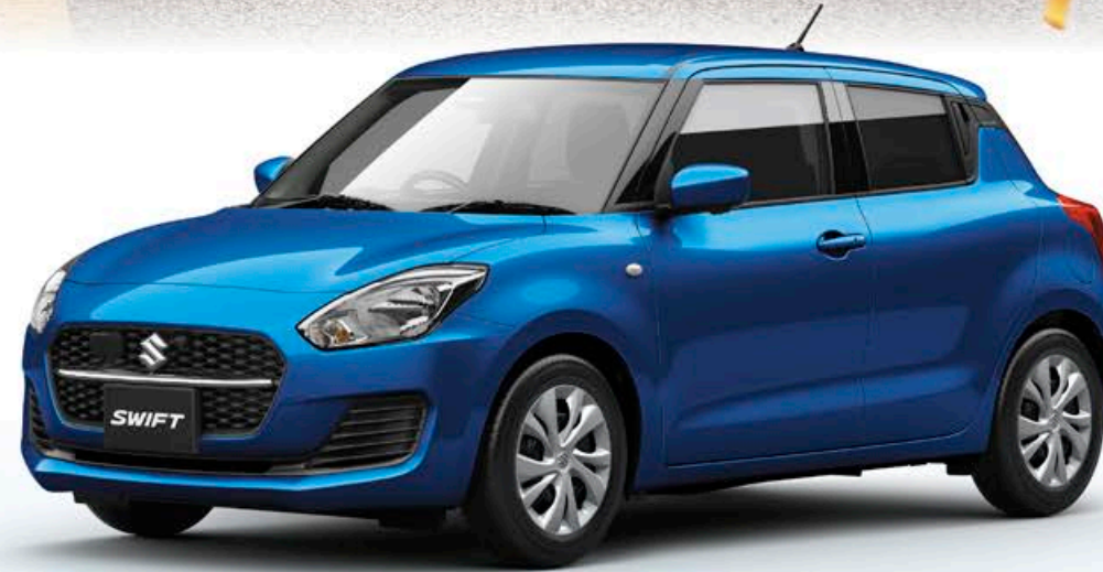
Photo:XG 全方位モニター用カメラパッケージ装着車 ボディカラーはスピードブルーメタリック