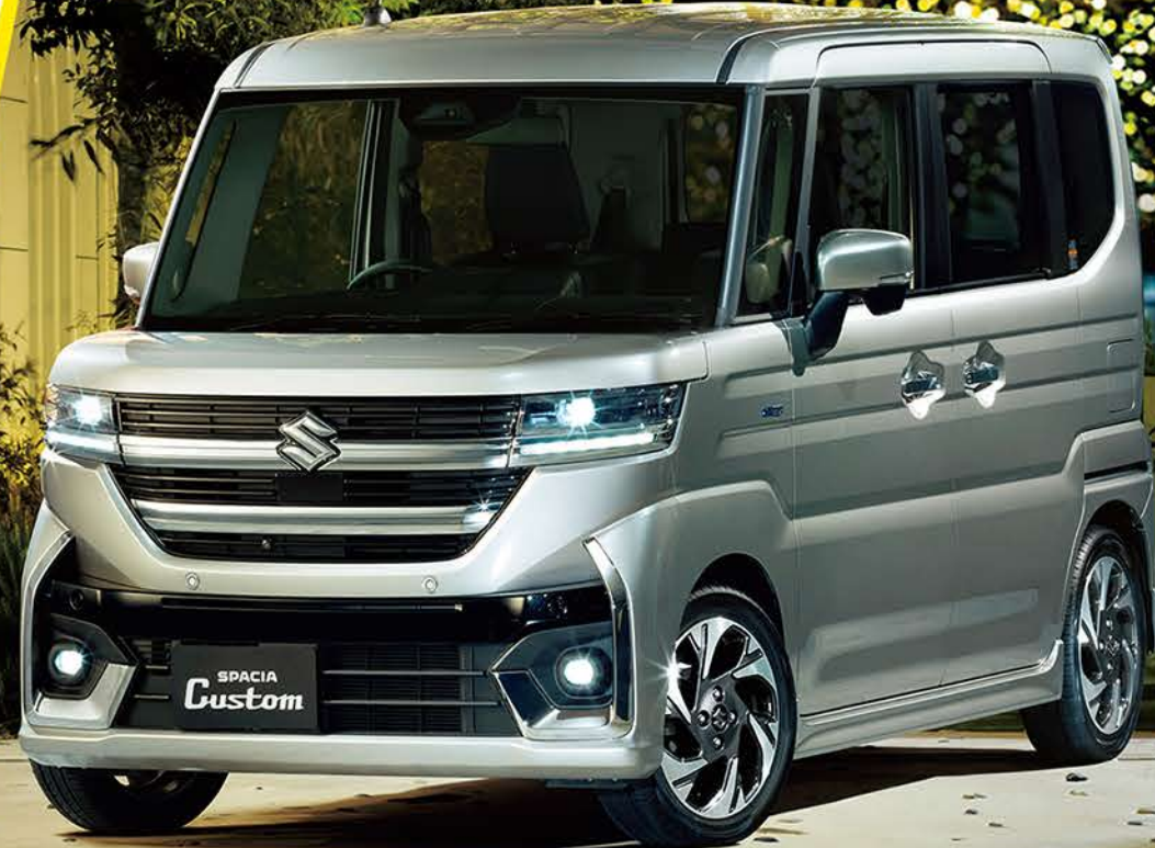
Photo:HYBRID XS スチールシルバーメタリック

スペーシア カスタム HYBRID XS 2WD-CVT車 車両本体価格 1,995,400円* (消費税抜き1,814,000円)