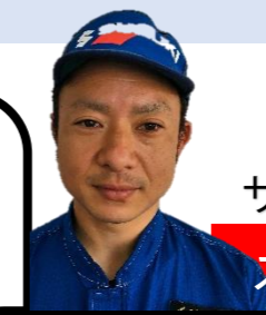
サービス とくだ 営業 みねかわ スズキー級整備士