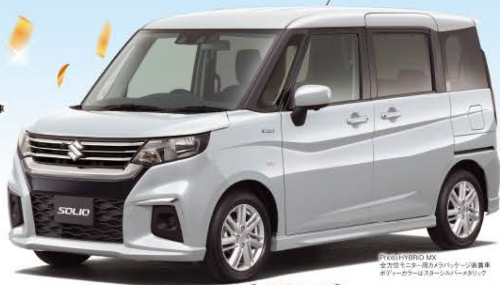
Photo:HYBRID MX 全方位モニター用カメラパッケージ装着車 ボディカラーはスターシールパールメタリック