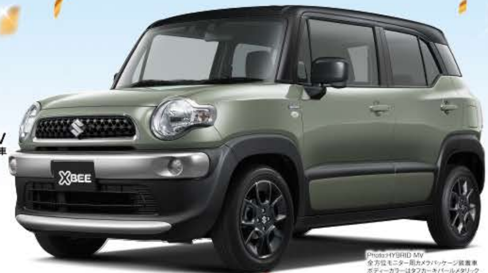
Photo:HYBRID MV 全方位モニター用カメラパッケージ装着車 ボディカラーはタフカーキパールメタリック ブラック2トーンルーフ