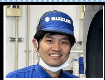
サービス：やまむら