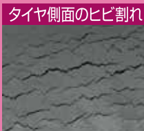
タイヤ側面のヒビ割れ

ヒビ割れを見たら要注意。正しい方法で保管しましょう。そのまま乗り続けると小さなヒビ割れも大きくなってしまいます。