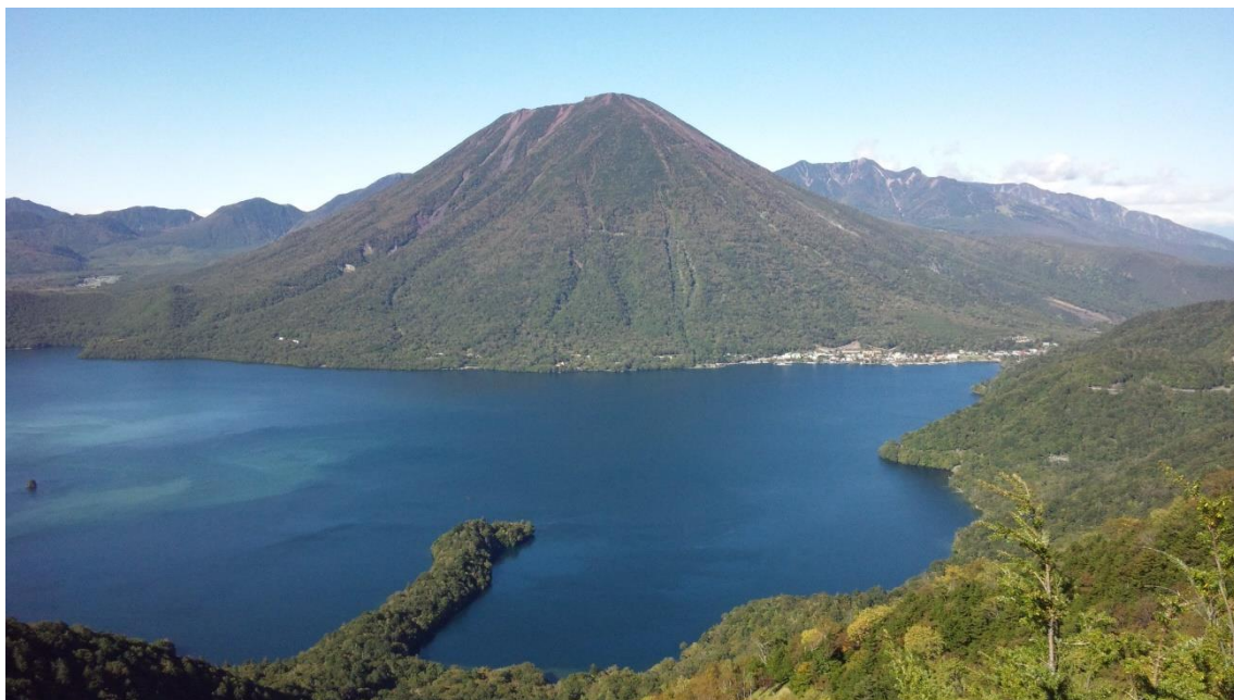
(対岸の半月山から見た、中禅寺湖と男体山)