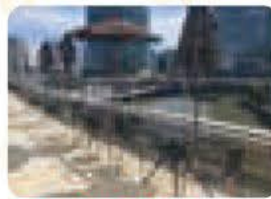
テラス席もあります。