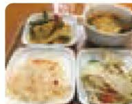
ランチにはミニピュッフェが付きます。

ご愛用車:エブリイ ご愛用中のエブリイは、本 場タイから空輸した食材 (野菜や香辛料)の配達に 毎日使用しています。燃費 も使い勝手も良く気に入 っています!と嬉しいお言 葉を頂きました。