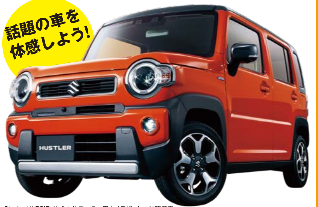
Photo: HYBRID X 全方位モニター用カメラパッケージ装着車 ボディカラー: パーミリアンオレンジ ガンメタリック2トーン