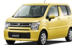
2017年 2月 6代目ワゴンR