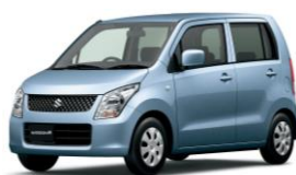
2008年 9月 4代目ワゴンR