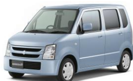
2003年 9月 3代目ワゴンR