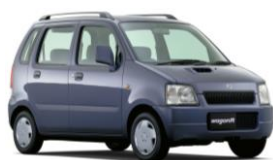
1998年 10月 2代目ワゴンR