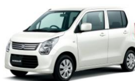
2012年 9月 5代目ワゴンR