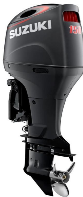
DF150A (マットブラック仕様)