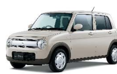
< ラパン >