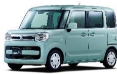
< スペーシア >