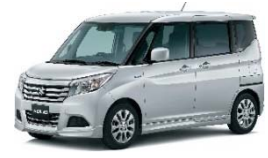
< ソリオ >