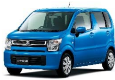
< ワゴンR >