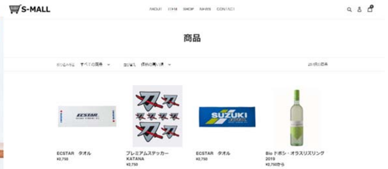
販売サイトイメージ

スズキ株式会社は、インターネットを利用した販売サイト「S-MALL(エスマール)」を立ち上げ、2021年1月11日午前11時より公開する。