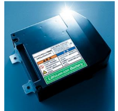
リチウムイオン電池

スズキ株式会社は、自動車リサイクル料金の収支余剰金を活用した自社公益事業として、市場の廃車から回収した小型リチウムイオン電池をソーラー街灯用電源に二次利用（リユース）する技術を開発しました。